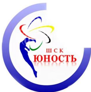
Эмблема ШСК «Юность»