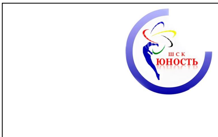
Флаг ШСК «Юность» (эмблема на белом полотне)