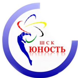
Значок ШСК «Юность»

Форма ШСК «Юность» - синее трико, белая футболка, на спине надпись «Юность»